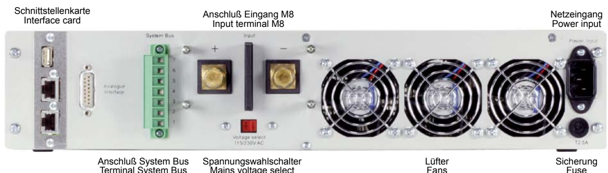
Schnittstellenkarte Interface card