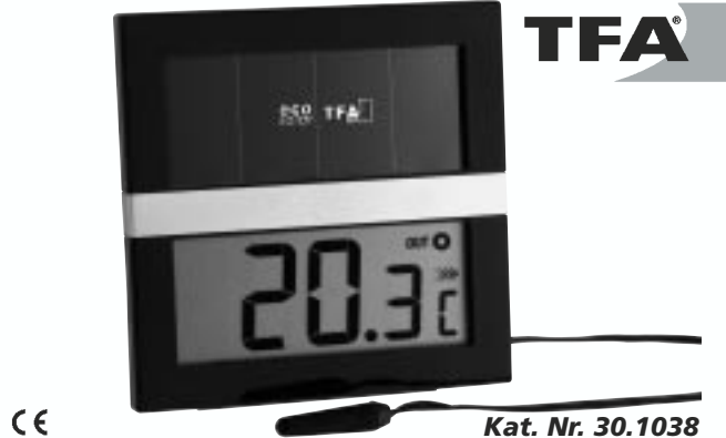
CE Kat. Nr. 30.1038